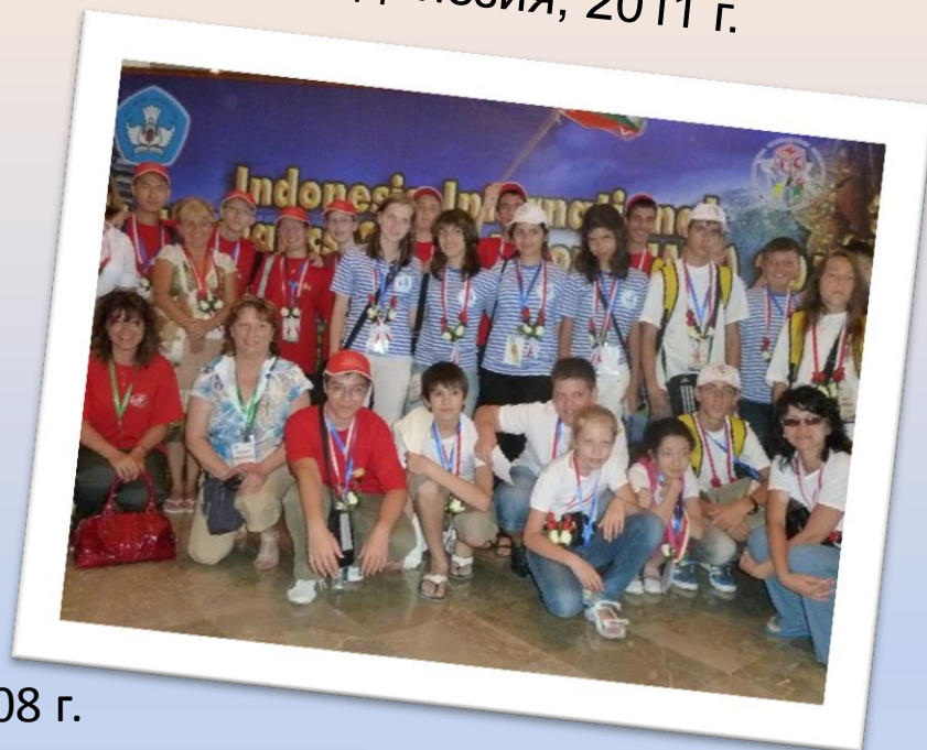
Индонезия, 2011 г.