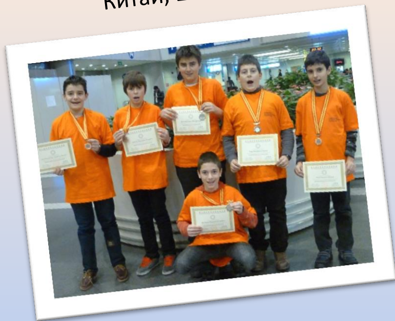
Китай, 2012 г.